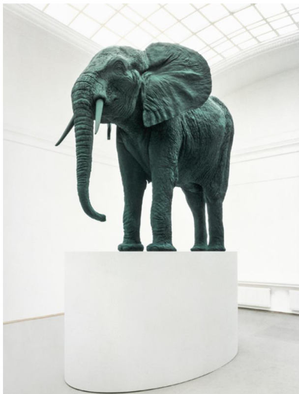
Í lok skýrslunnar er hið stórbrotna listaverk Elefant eftir Katharina Fritsch, 1987